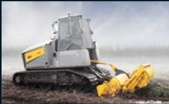
Peltojen raivaukseen: Murskausjyrsin MJH-350 DTG