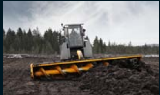
Turvemaiden muotoiluun: Ruuvitasaaja RT-600 T