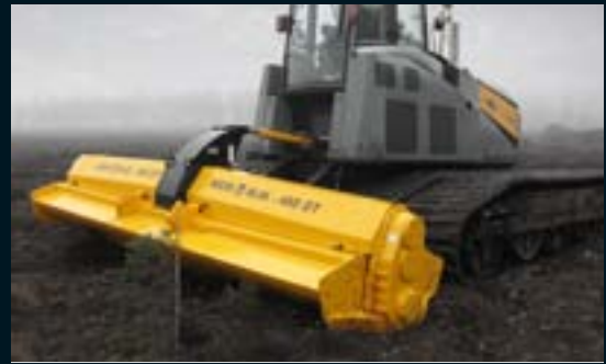
Turvemaiden kunnostusjyrsintään: Kunnostusjyrsin MJK-480 DT